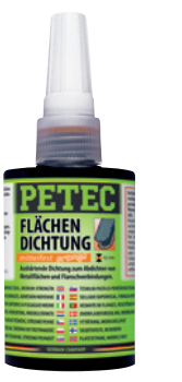
orange, mittelfest, 75 ml Art.-Nr. 97175