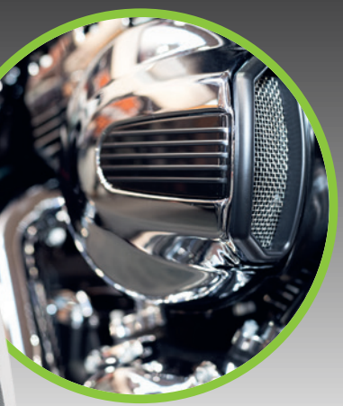
Bike Cleaner 500 ml Sprühflasche Art.-Nr. 60150