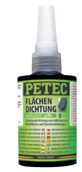
Flächendichtung, aushärtend grün, niedrigfest, 75 ml Art.-Nr. 97075