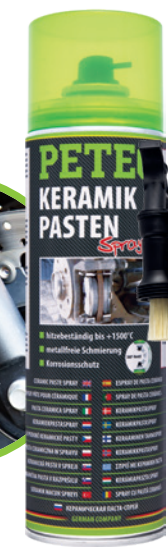
Keramikpastenspray 500 ml Spray Art.-Nr. 70650