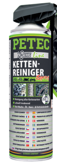
Kettenreiniger Spray 500 ml Spray Art.-Nr. 70540