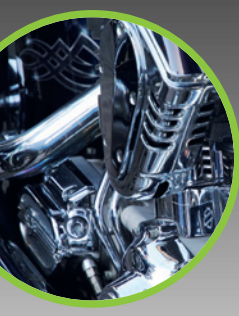
Edelstahlreiniger Spray 500 ml Spray Art.-Nr. 70260