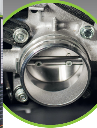
Ansaugsystem-, Drosselklappen- & Vergaserreiniger 500 ml Spray Art.-Nr. 72450