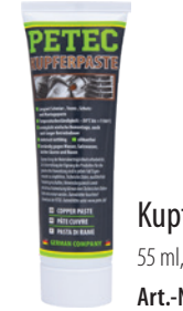
Kupferpaste 55 ml, Tube Art.-Nr. 94550