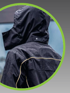
Imprägnierspray „One for all“ 500 ml Spray Art.-Nr. 72750