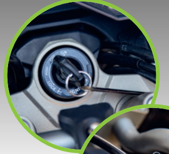
Motorstarthilfe 500 ml Spray Art.-Nr. 70450