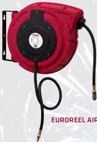
EUROREEL AIR 8/10

STATTPREIS 113,- -17% 94,- UVP INKL. 20% MWST. 112,80 STATTPREIS 170,- -18% 139,- UVP INKL. 20% MWST. 166,80