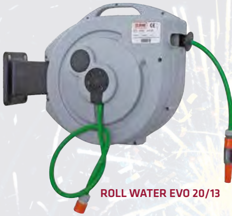
ROLL WATER EVO 20/13