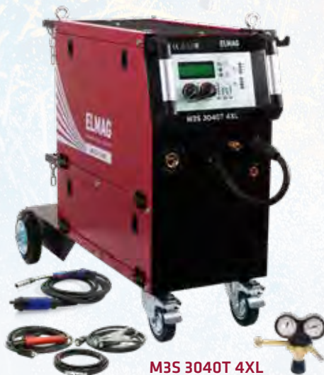
M3S 3040 T 4XL