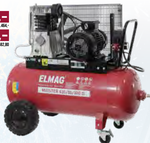
MEISTER 610/10/100 D

STATTPREIS 1.460,- 1.319,- UVp INKL. 20% MWST. 1.582,80