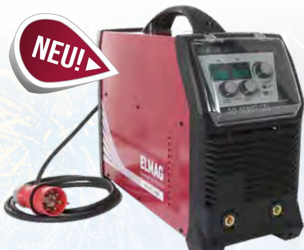
SD 4060T CEL

STATTPREIS 1.269,- 1.199,- UVP INKL. 20% MWST. 1.438,80