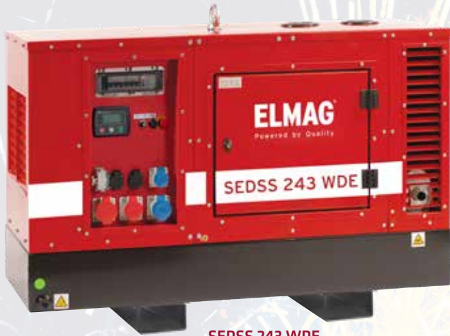
SEDSS 243 WDE