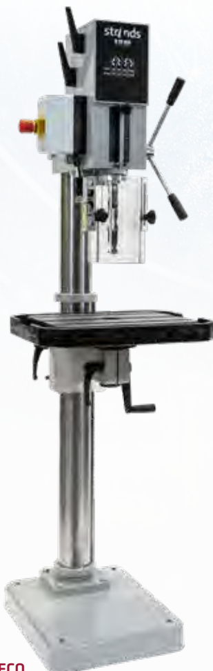
R 25 ECO