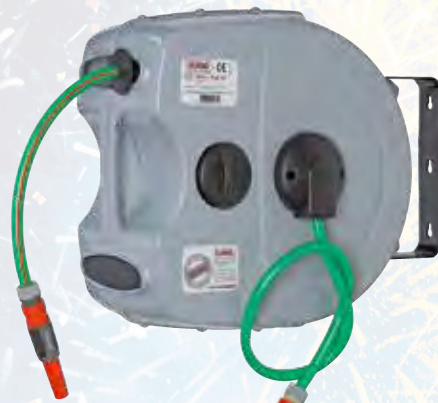
ROLL WATER MEGA 20/16