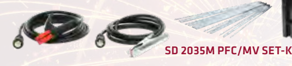
SD 2035M PFC/MV SET-K

+ jetzt im SET-K zusätzlich inkludiert! Transportkoffer groß, je 20 Stk. Rutil-Schweißelektroden Ø 2,5x350mm & 3,2x350mm