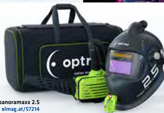
Optrel® vegaview 2.5

panoramaxx 2.5 elmag.at/57214 STATTPREIS EXKL. MWST. 2.030,- 1.715,- PARANIT -16% UVP INKL. 20% MWST. 2.058,-