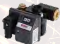
Autom. Kondensatableiter AKA 1/2", 230 Volt