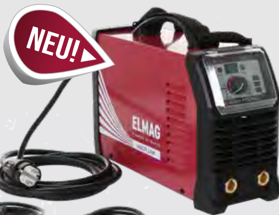
SD 1635M PFC/MV

STATTPREIS 419,- 399,- UVP INKL. 20% MWST. 478,80