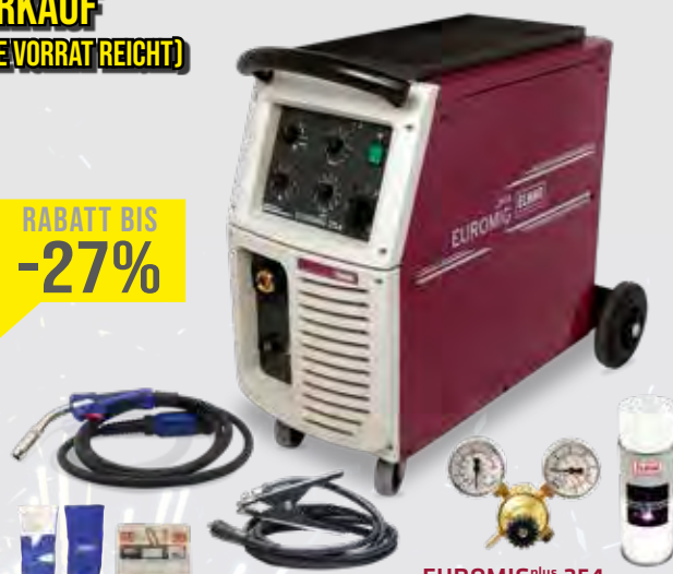
EUROMIG plus 254

GRATIS! Verschleißteile-Set und ein Paar Schweißer-Handschuhe