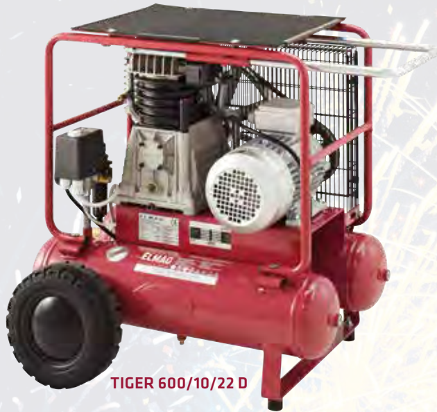
TIGER 600/10/22 D