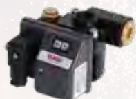
Autom. Kondensatableiter AKA 1/2", 230 Volt