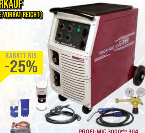
PROFI-MIG 3000 plus 304

GRATIS! Verschleißteile-Set und ein Paar Schweißer-Handschuhe