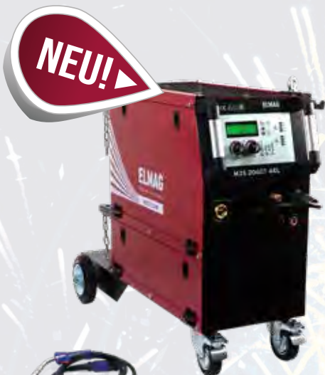
M3S 2060 T 4XL