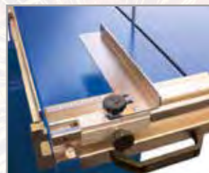
Winkel- und Gehrungs- anschlag im Set enthalten