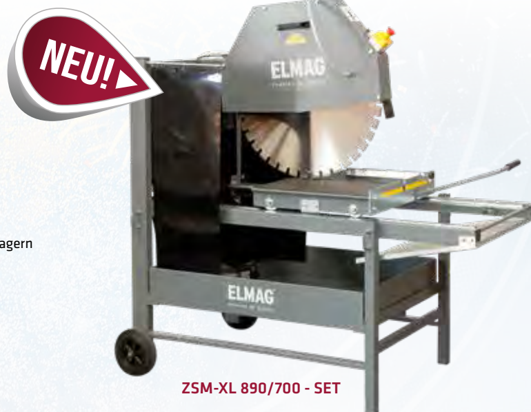
ZSM-XL 890/700 - SET