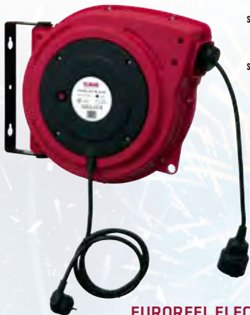
EUROREEL ELECTRIC 20/230

STATTPREIS 97,- -19% 79,- UVP INKL. 20% MWST. 94,80 STATTPREIS 147,- -19% 119,- UVP INKL. 20% MWST. 142,80