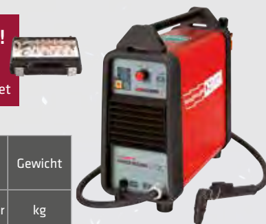
POWER PLASMA 3035/M