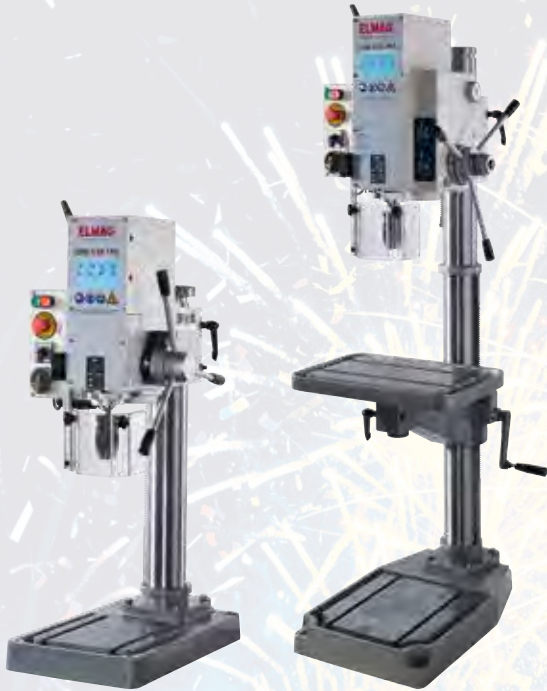
GBM 3/25 TNE