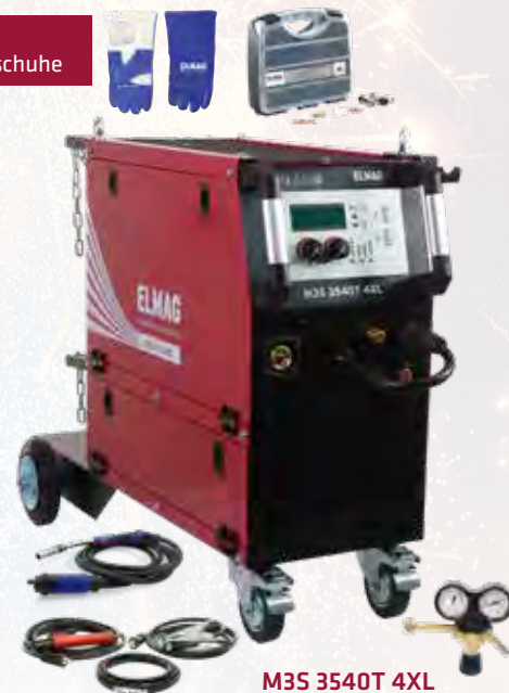
M3S 3540 T 4XL