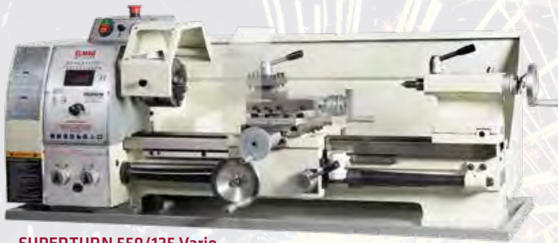
SUPERTURN 550/125 Vario