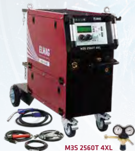
M3S 2560 T 4XL